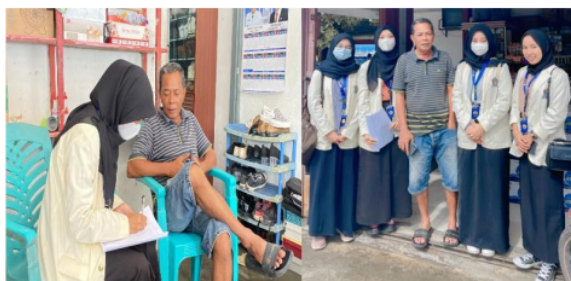
Gambar 1. Wawancara masyarakat (nelayan)

Selain sebagai nelayan, profesi masyarakat daerah Bungus adalah petani karena lahan pesawahan yang cukup luas untuk perkebunan juga ada tapi tidak terlalu luas seperti karet dan biasanya masyarakat sebagai petani ini tinggal di Kecamatan Bungus bagian Timur (Hairunnisa, Nurizzati, & Ismail, 2018). Ekonomi masyarakat daerah Bungus ini rata – rata menengah kebawah. Kesusahan yang dialami masyarakat disini terutama nelayan adalah keadaan alam jika keadaan alam baik maka hasil perekonomian juga akan baik. Untuk kendala yang lain tidak ada karena akses menuju Bungus juga mudah dan tergolong baik. Akan tetapi, jika terjadi perubahan pada ekosistem itu akan mengakibatkan perubahan struktur kehidupan sehingga pemanfaatan sumber daya akan sulit dilakukan (Handrina, 2021) Pada acara MBSA ini juga dilakukan pemeriksaan kesehatan didapatkan sebagian besar masyarakat daerah Bungus ini mengalami masalah kesehatan berupa penyakit kulit. Gangguan pada kulit sering terjadi karena beberapa faktor penyebab antara lain iklim, lingkungan tempat tinggal, kebiasaan hidup yang kurang sehat dan bersih, alergi dll. Penyakit kulit sendiri bisa disebabkan oleh bakteri dapat diketahui bahwa keadaan didaerah pesisir sangat rentan terhadap penyakit kulit berupa gatal- gatal, panu, kurap, dan kutu air. Ini biasanya disebabkan oleh kondisi air yang kurang baik, kualitas kebersihan yang kurang.