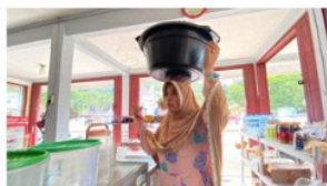
Gambar 2. Wawancara masyarakat

Potensi sumber daya alam di Kecamatan Bungus Kota Padang sangat melimpah terutama sumber daya bahari. Kawasan daerah bungus memiliki banyak pulau dan pantai yang dijadikan sebagai objek wisata. Pantai di daerah Bungus