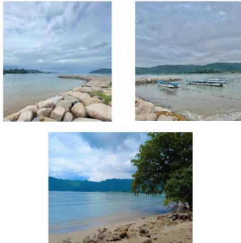
Gambar 3. Potensi Alam Kecamatan Bungus

Masyarakat di daerah ini juga kurang memanfaatkan keindahan alam sebagai objek wisata yang dapat menarik wisatawan rata-rata masyarakat disini memanfaatkan laut hanya untuk menangkap ikan saja. Pemanfaatan pantai sebagai objek wisata akan dapat menambah hasil perekonomian masyarakat setempat. Kegiatan pengabdian berupa dokumentasi ini juga bertujuan untuk mempromosikan potensi alam yang ada di daerah Bungus mulai dari keindahan alamnya dilakukan dengan mempromosikan potensi alam melalui sosial media dengan membagikan foto dan video mengenai potensi alam pada Kecamatan Bungus. Dengan adanya promosi ini diharapkan semoga dapat membantu kehidupan perekonomian masyarakat di daerah Bungus.